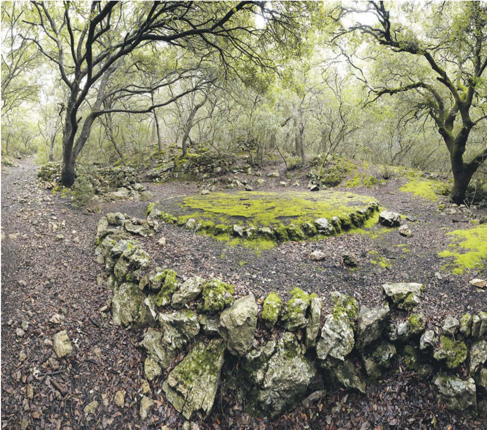
■ Aus einem Dutzend Einzelfotos zusammengesetztes, bis ins letzte Detail scharfes Steinkreis-Foto: 500 Megabyte für einen Köhlerplatz.